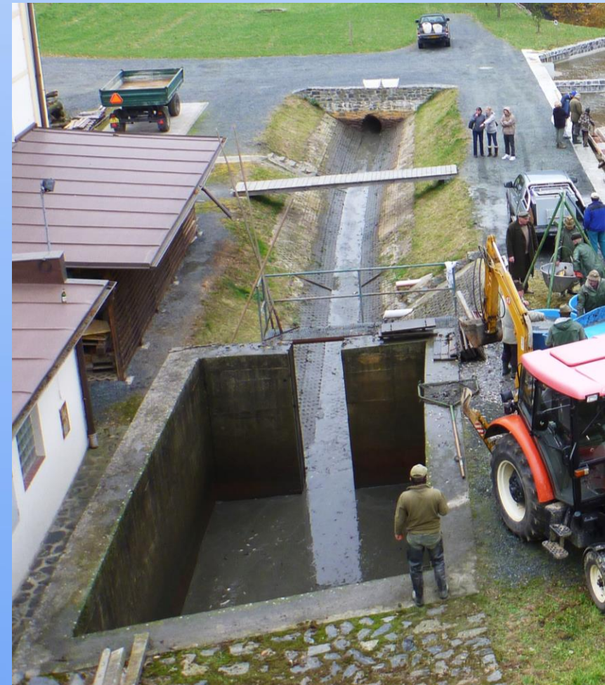
Loviště pod hrází Jezuitského rybníka na toku Hostačovky (okr. Havlíčkův Brod)