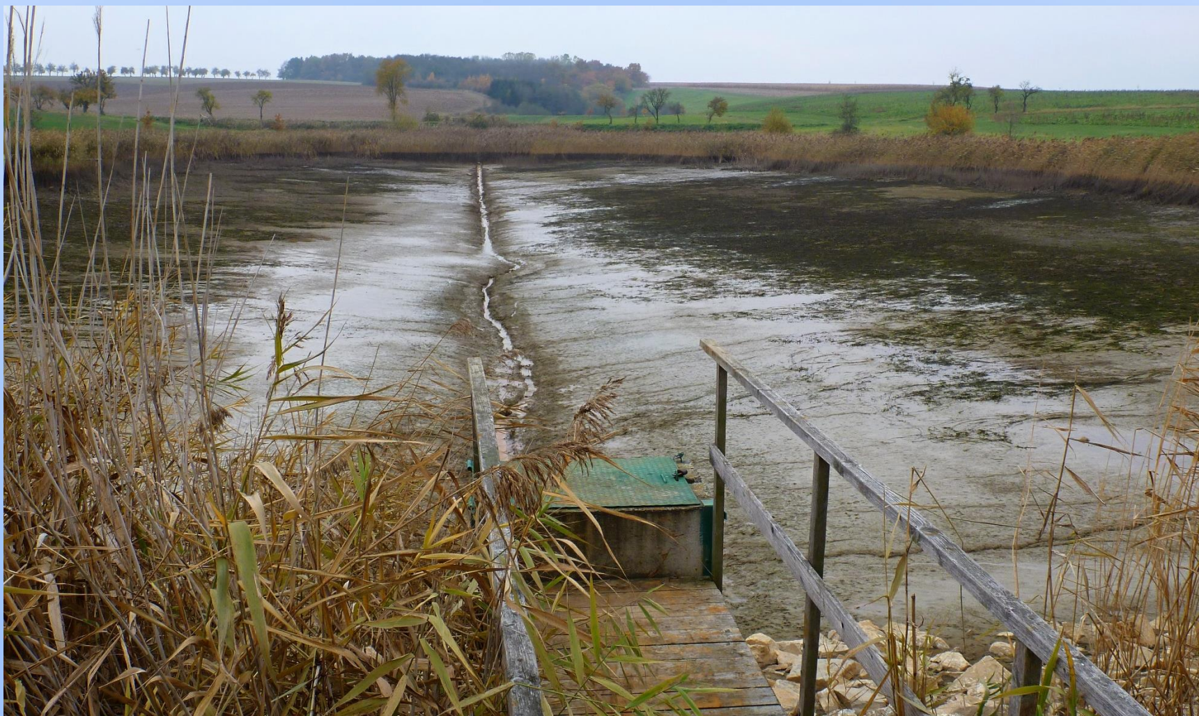
Rybník na levostranném přítoku Hostačovky u Sírákovic (okr. Havlíčkův Brod)