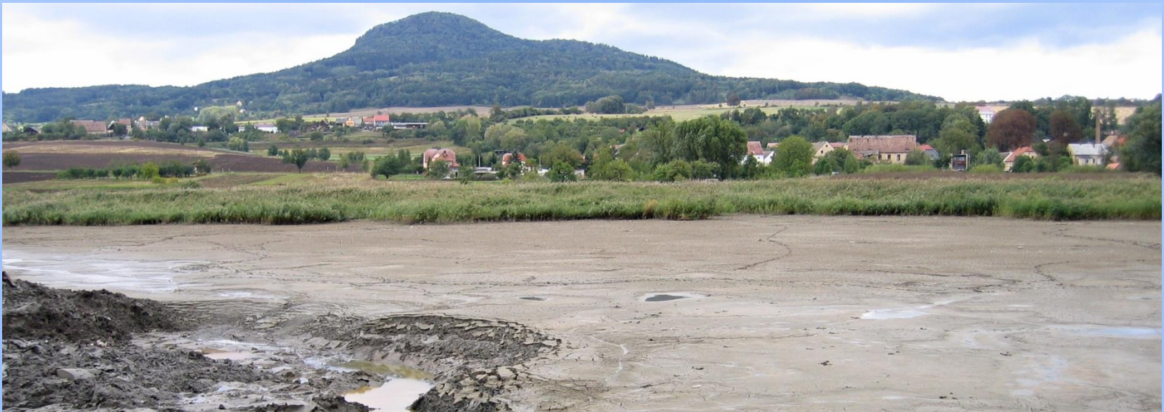
Liběšický rybník na Studeném potoce u Liběšic (okr. Litoměřice)