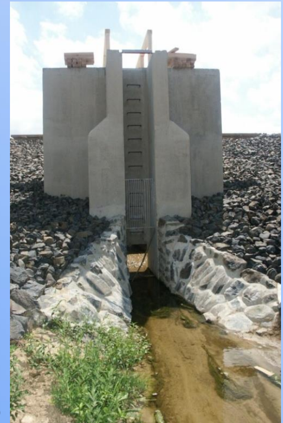
MVN na Studeném potoce u Břehorj (okr. Litoměřice)