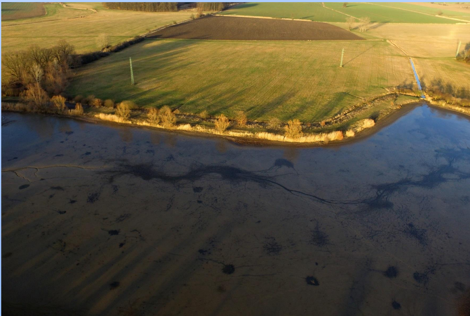
Rybniční Homoláč na toku Kanice u Lodína (okr. Hradec Králové)