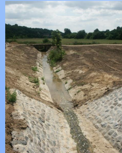
MVN na Studeném potoce u Břehorj (okr. Litoměřice)