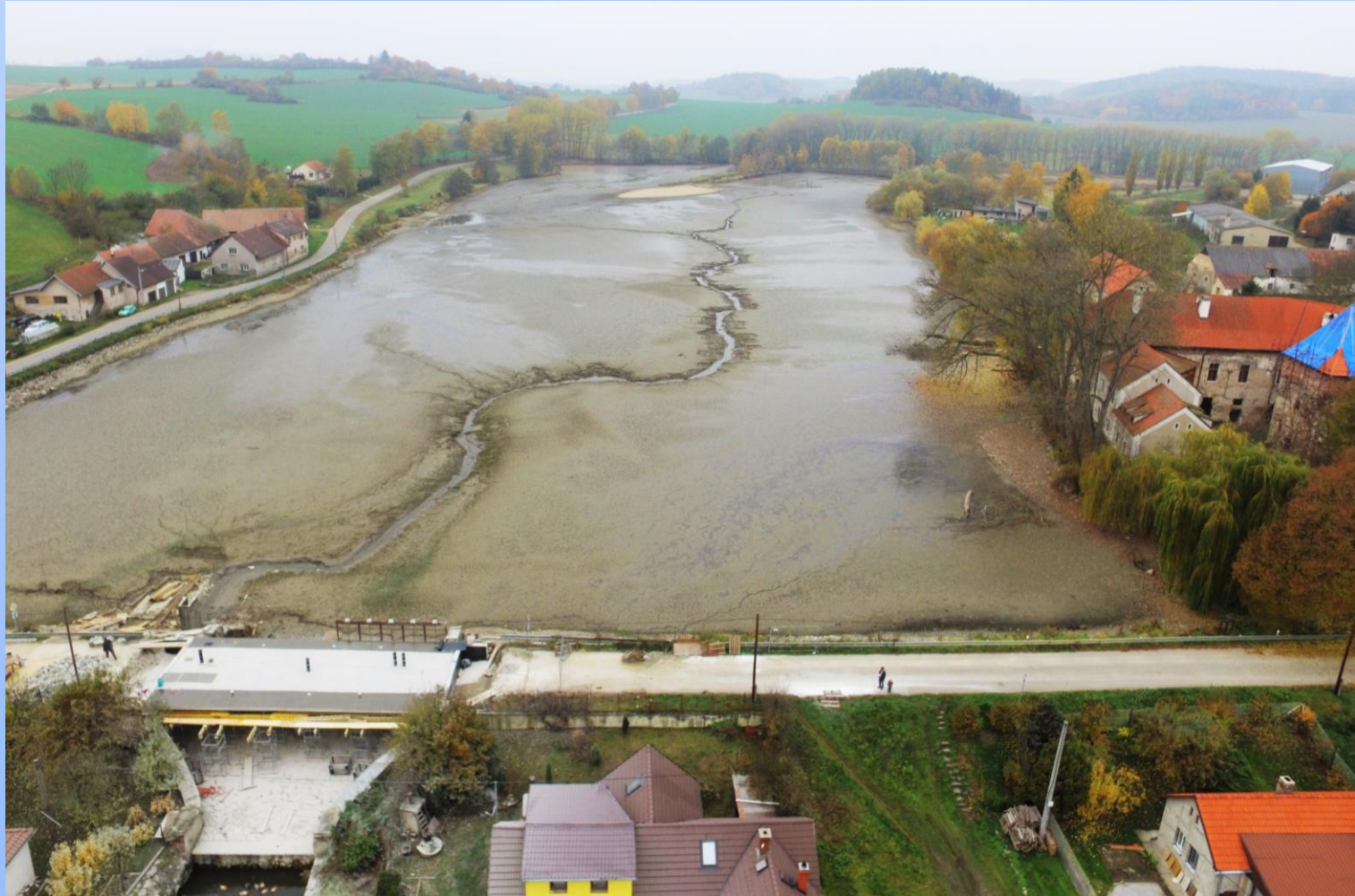
Popovický rybník na Chotýšance v Popovicích (okr. Benešov)