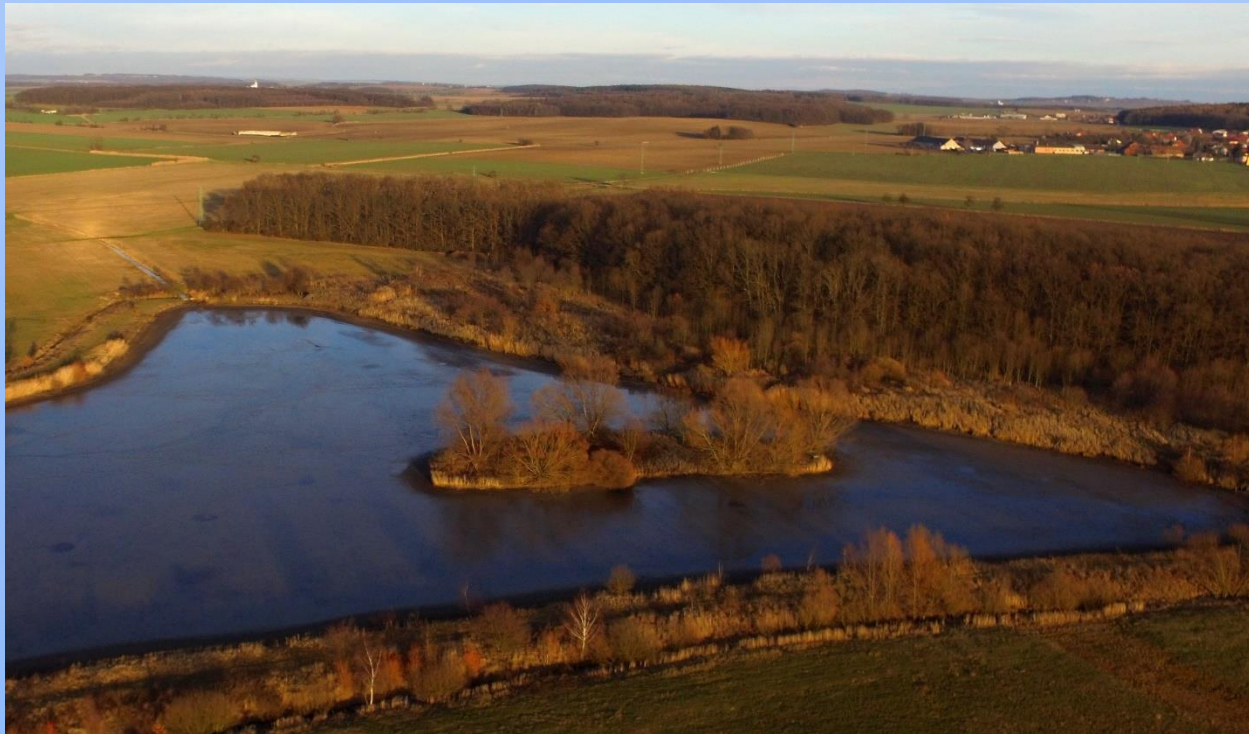
Rybník Homoláč na toku Kanice u Lodína (okr. Hradec Králové)